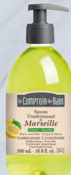
Le Comptoir du bain