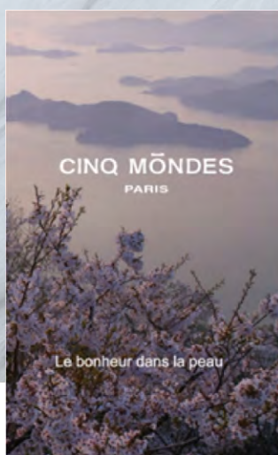
Le bonheur dans la peau