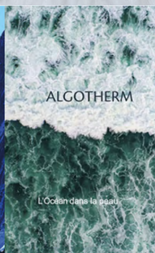
L'Océan dans la peau