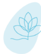
SPAS & Instituts